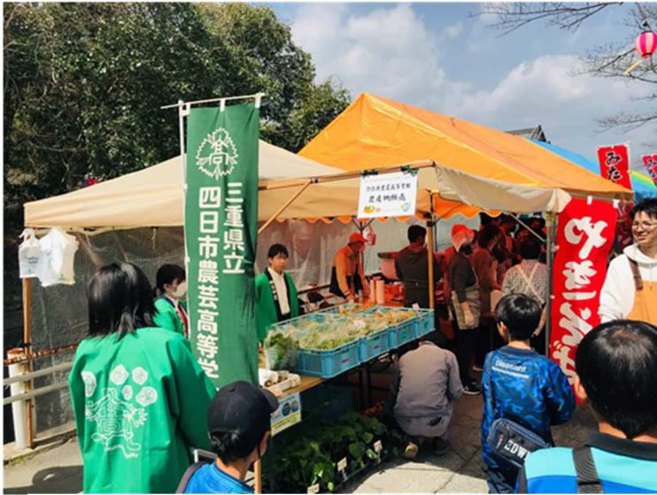
地域の行事などでいつも協力いただいている農芸高校さんによる『みのりの丘マーケット』の新鮮な野菜、卵などの販売も人気でした