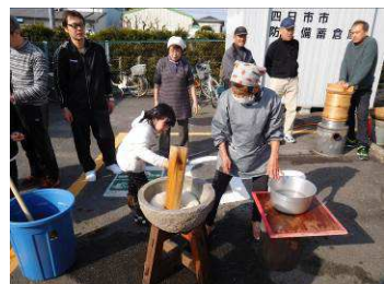
三世代交流もちつき大会