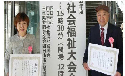
本年度 社会福祉大会へ 15時30分(開場) 12時 四日市市社会福祉協議会 三重県共同募金会四日市市共同募