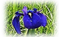
ノハナショウブ(5月頃)

◎問合せ: 社会教育・文化財課 ☎: 354-8238 Eメール: syakaibunkazai@city.yokkaichi.mie.jp